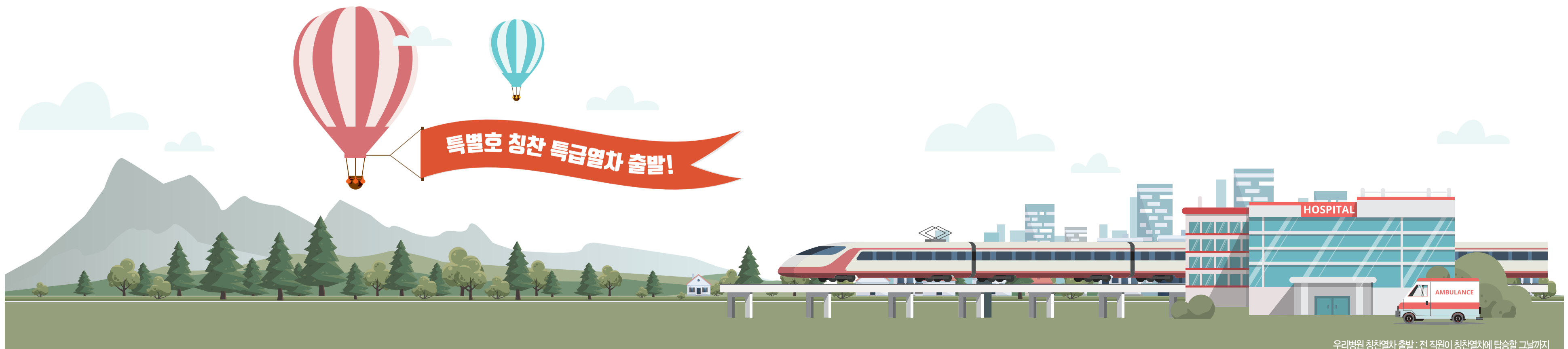
우리병원 칭찬열차 출발 : 전 직원이 칭찬열차에 탑승할 그날까지